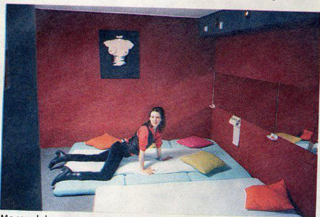
Me sex club

'Ik beschilder of bekras mijn films beeld voor beeld, heel nauwkeurig.'